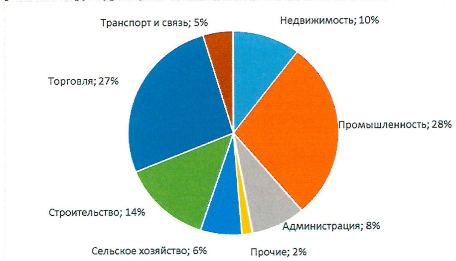
Отраслевая структура ссудной задолженности юридических лиц на 01.01.2020, %

Кредитная политика Банка направлена в первую очередь на финансирование предприятий реального сектора экономики Рязани и Рязанской области, в том числе предприятий малого и среднего бизнеса.